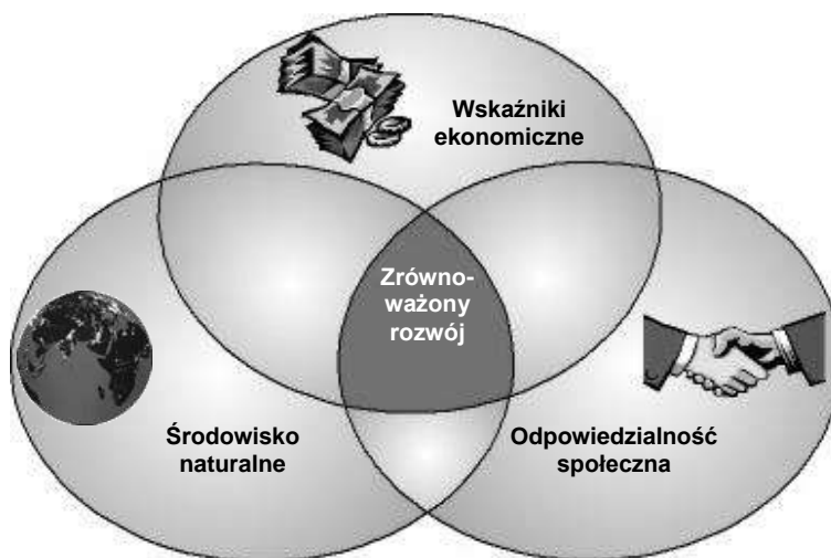
S c h e m a t 2. Model zrównoważonego rozwoju

Zespoły w każdym kraju zbadały wpływ działalności ABB na społeczeństwo w rozbięciu na trzy grupy: pracowników i ich rodziny, społeczność lokalną oraz cały kraj. Raporty powstałe z przeprowadzonych badań zostały użyte do stworzenia nowych zasad polityki